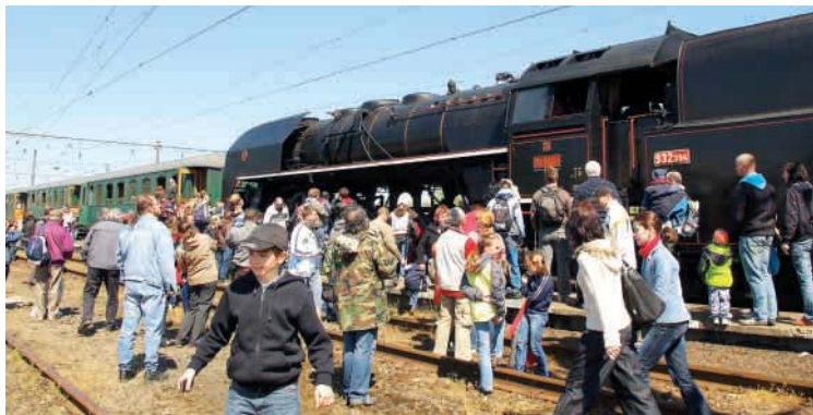
O jízdu parním vlakem byl při loňských slavnostech velký zájem.