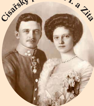
Císařský pár Karel I. a Zita

90. výročí úmrtí blahoslaveného císaře a krále Karla I. Rakouského a 120. výročí narozenin císařovny Zity