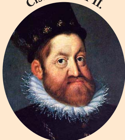
Císař Rudolf II.

400. výročí úmrtí a 460. výročí narození císaře Rudolfa II.